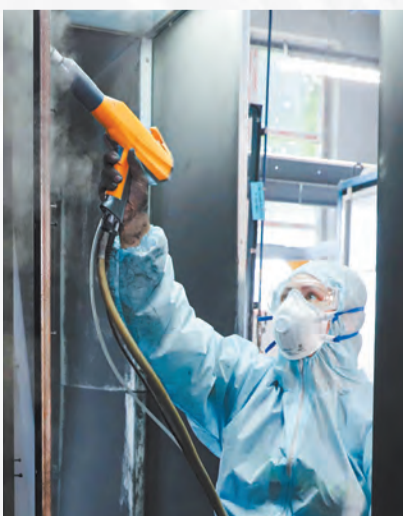
Рабочие процессы в ОАО «ИНТЕГРАЛ»