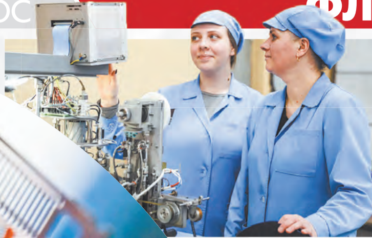
Рабочие процессы в ОАО «ИНТЕГРАЛ»

«Интеграл» в Минске, так и на выставке KINE-2026 в Казахстане. Там собирается весь топ-менеджмент от медицины из более чем 20 стран мира.