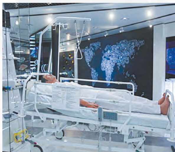
Музей ОАО «ИНТЕГРАЛ»