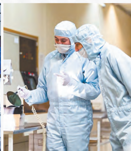
Рабочие процессы в ОАО «ИНТЕГРАЛ»