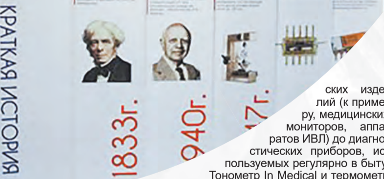
Музей ОАО «ИНТЕГРАЛ»