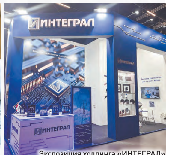
Экспозиция холдинга «ИНТЕГРАЛ» на Международной промышленной выставке «ИННОПРОМ. Беларусь» (сентябрь 2025-го)