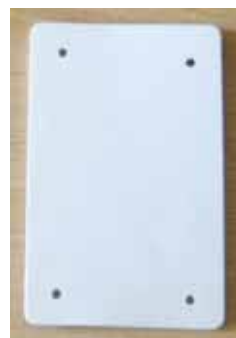
МЕТКА РАДИОЧАСТОТНАЯ ИЦФУ.467649.005

Программно-аппаратный комплекс позволяет производителям сборного железобетона оптимизировать все свои производственные графики и процессы дистрибьюции продукции. RFID-данные используются для того, чтобы идентифицировать конструкцию, решать проблемы, связанные с определением уровня ее качества, а также для того, чтобы надежно гарантировать правильность отправки продукции заказавшим ее клиентам.